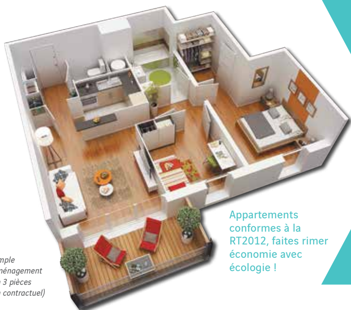
Exemple d'aménagement d'un 3 pièces (non contractuel)

Appartements conformes à la RT2012, faites rimer économie avec écologie !