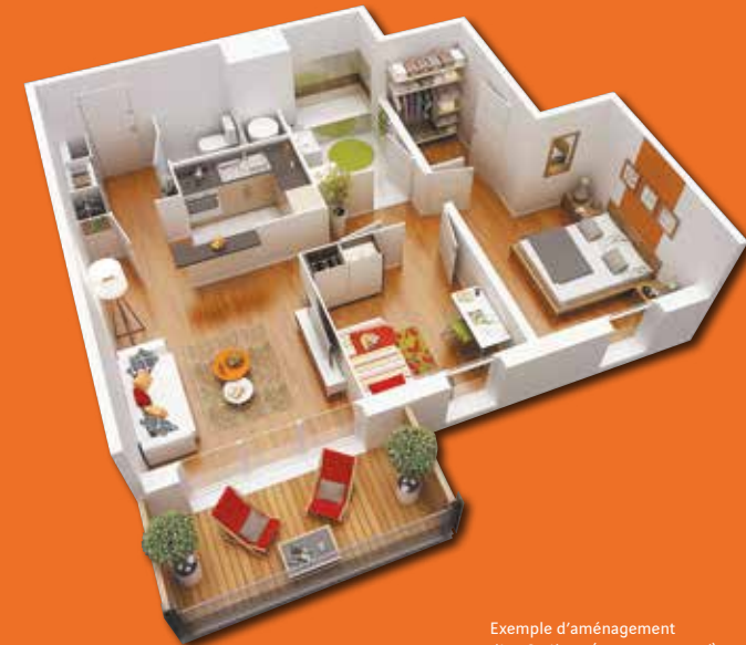
Exemple d'aménagement d'un 3 pièces (non contractuel)