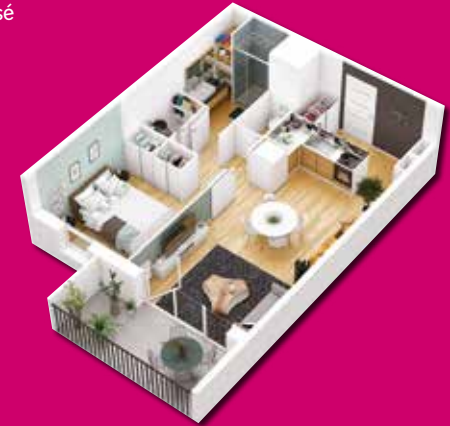
Exemple d'aménagement d'un 2 pièces (non contractuel)