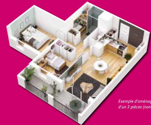
Exemple d'aménagement d'un 3 pièces (non contractuel)